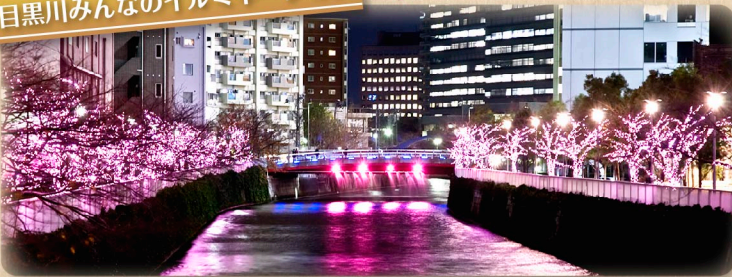
⑨目黒川みんなのイルミネーション