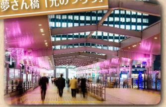
⑧夢さん橋「光のつらら」