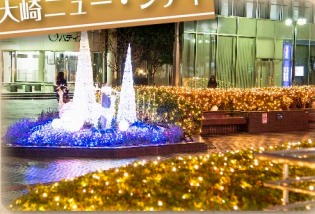
①大崎ニュー・シティ

大崎駅周辺のまちを飾る冬の夜の風物詩。まちとまちがつながり、人と人、人とまちもつながっていく、そんな願いを込めるかのように、優しく各所で灯るイルミネーションネットワーク。冬の景観資源を生かした個性的で優しい光のフロアが、今年も咲きそります。