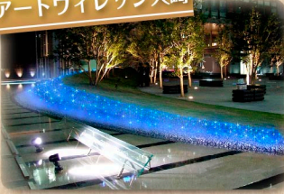
⑦アートヴィレッジ大崎