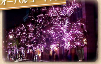
⑥オーバルコート大崎

目黒川沿いの桜を100%自家発電によるLEDライトの光で飾り、冬に咲き光る桜の並木道出現する「目黒川みんなのイルミネーション」。まちへの愛着と誇り、CO 2 の削減や電力のあり方をも見直すきっかけともなりそうな、冬の宵の一大イベントに!