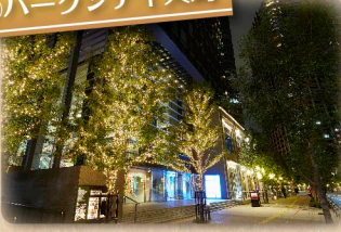
⑤パークシティ大崎