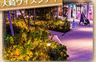
④大崎ウィズシティ