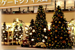
②ゲートシティ大崎