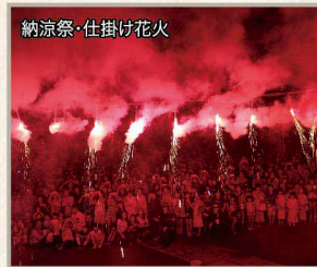
納涼祭・仕掛け花火