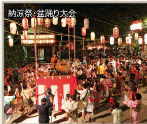
納涼祭・盆踊り大会

遡ること400年以上も前、武蔵国荏原郡居木橋村(現在の山手通り居木橋付近)にて創建されたと伝えられる居木神社。江戸時代初期、目黒川の氾濫を避け、村内の四社を合祀して現在地に遷座、その後さらに三社を合祀して今に至る、郷土の崇敬著しいこの歴史の神社をご紹介します。大崎の社の昔と今を訪ねます。