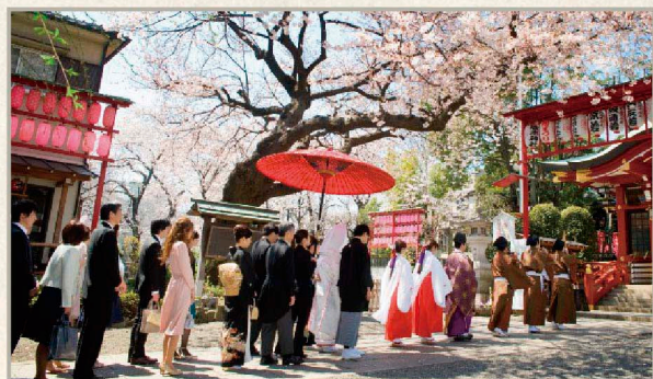
かつて地域の人々が集い、祝う場でもあった神社での結婚式。今またその価値が見直され、若い世代を中心に多くのカップルがここで結ばれています。写真は、雅楽の生演奏をアレンジした居木神社オリジナル「参進」の儀式。