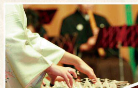
外国人日本文化体験の催しも

家族の成長の尊い思い出をつくる「一心泣き相撲」など、忘れかけていた日本人独自の「人生の通過儀礼」を、居木神社なりの新しい所作を通じて執り行っています。