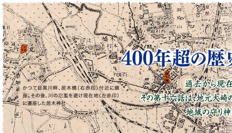
かつて目黒川畔、居木橋(右赤印)付近に鎮座。その後、川の氾濫を避け現在地(左赤印)に遷座した居木神社

過去から現在、未来へと受け継がれていく「ふるさと 大崎」のDNA(原風景)を訪ねる『大崎今昔物語』。 その第十六話は、地元大崎の守護神、居木神社が守り続ける郷土の伝統と儀式。そして、時代の変遷の中でも変わることのない人々の人生行事。 地域の守り神として大崎のすべての氏子の安寧を祈り、その暮らしに寄り添う居木神社の日々がここにありました。