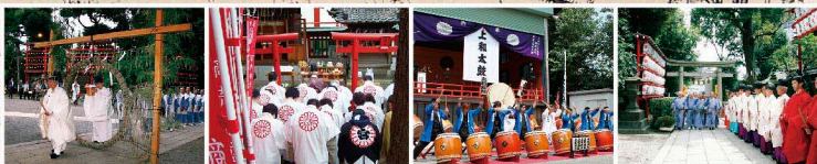
夏越天祓(茅の輪くぐり) 稲荷・厳島神社例大祭(春祭り) 居木神社例大祭での和太鼓演奏 壮麗な例大祭神事