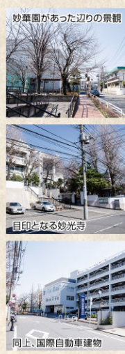
同上、国際自動車建物