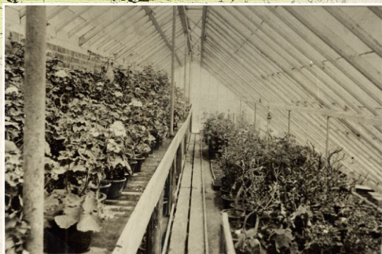
「妙華園」の温室で栽培された西洋植物などの花々は銀座などの当時最先端の街で売られたほか、地方の園芸家の熱心な要望に応えた通信販売も行われていました。