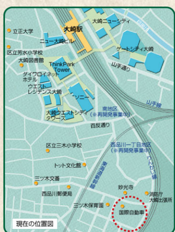
「妙華園」は、その名の由来とも言われる妙光寺に隣接して存在。但し今ではもう当時の面影は見当たりません。